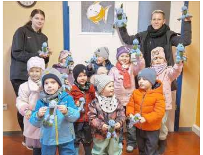
Das Dino-Projekt in der Schöne Aussicht begeistert die kleine Dino-Fans.

Dinosaurier faszinieren Kinder jeden Alters und bieten eine spannende Möglichkeit, viele verschiedene Lernbereiche zu erkunden. Im Rahmen des Dino-Projektes werden verschiedene Aktivitäten durchgeführt, um das Interesse der Kinder zu wecken und ihr Wissen zu vertiefen.