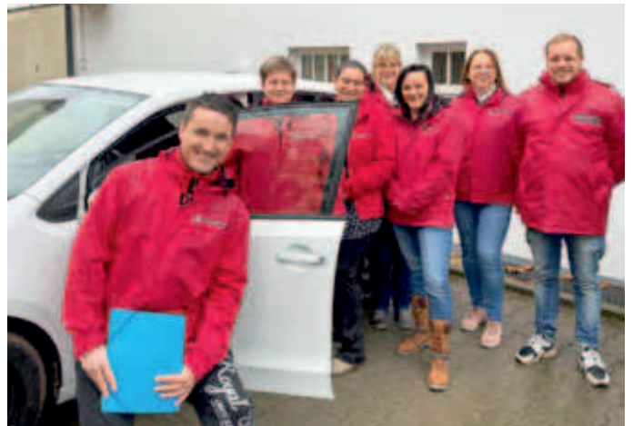
Das Team der Johanniter in Werdau.

Auch bei den Johannitern steht Nachhaltigkeit als ein wichtiges Thema auf der Agenda. Bereits seit Anfang 2017 sind sie mit E-Autos in unserem ambulanten Pflegedienst in Zwickau unterwegs. Nun endlich auch in Werdau! Hier haben sich die Johanniter 3 neue Autos angeschafft, mit denen die Pflegerinnen und Pfleger mit grüner Energie zu den Klienten nach Hause unterwegs sind, denn diese Fahrzeuge sind gerade für Kurzstrecken sehr gut geeignet.